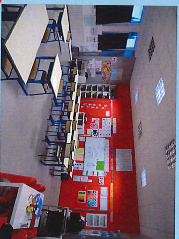
Cycle 3 : CM1- CM2