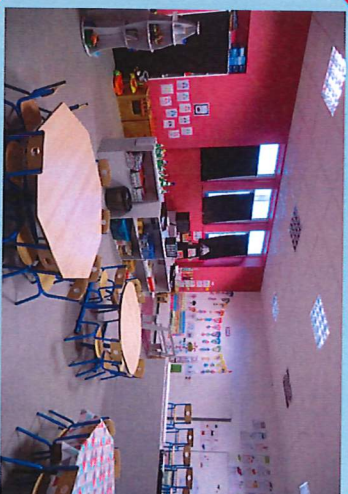
Cycle 2 : CP - CE1-CE2